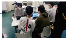
↑対面での勉強会の様子