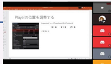
↑Discordでの勉強会の様子

主にブランチに所属している上級生が 下級生に向けて開催 基本的には、週に1回、講義で使用した 教科書や資料、WEBサイトを参考に PythonやUnityを教えている 現在は「Discord」を用いてオンライン で開催