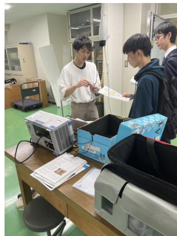
学部1年生向け説明会の様子