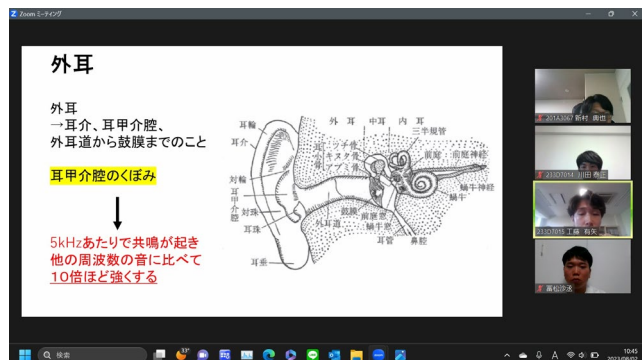
輪講型学習会の様子（2023.8.2開催）

「音を眺めて、触って、変えて、聴いてみよう-音声、聴覚、音響研究に携わった半世紀-」