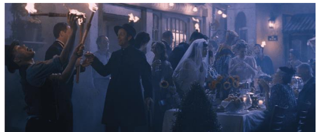
図4 MS-MIMOにおける受信画像 (PSNR: 54.17dB)