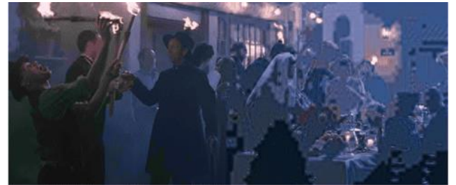
図3 MU-MIMOにおける受信画像 (PSNR: 28.61dB)