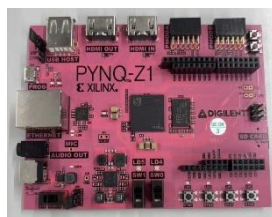
図3 FPGA ボード

集積回路であり, 複数の処理を同時に実行できる並列処理能力に優れるという特徴を持つ. レンズアレイの歪み補正処理などは, 画素単位での並列処理が可能であるため, FPGAとの親和性が高いと考えられる. ソフトウェアによる逐次処理では時間を要する計算も, FPGA上でハードウェアとして並列処理することで, 大幅な高速化が期待できる.