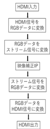
図4 映像補正システムの構築

現在は, システムの基盤となるHDMI映像のパスルー機能の確立に取り組んでおり, 詳細は当日発表する予定である.