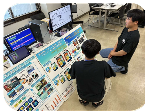
オープンキャンパスの様子