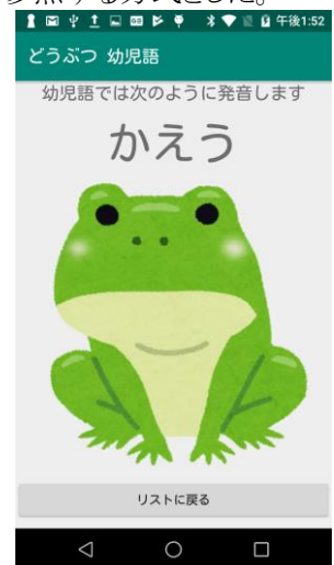
図3 幼児語表示画面の一例