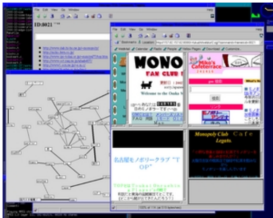
図2 Webブラウザでコミュニティを表示

が表示されているとは限らない。そのため、周辺コミュニティを追加表示する機能として、in-link/out-link 展開を実装した。in-link 展開は、指定したコミュニティへのリンクを持つコミュニティを、out-link 展開は、指定したコミュニティが参照しているコミュニティを追加表示する。