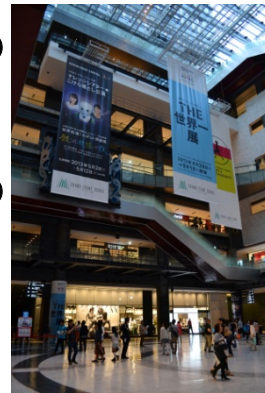
ナレッジプラザ写真 (→右写真)