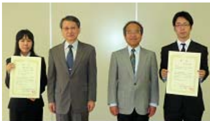
学生奨励賞受賞者