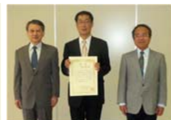
最多発表賞受賞者