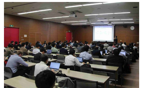
写真4 iWAT2024 口頭発表の様子