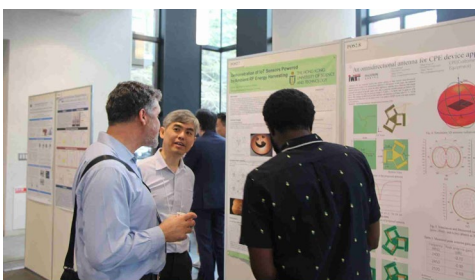
写真5 iWAT2024 ポスター発表の様子

iWAT2024には120篇の論文が投稿され、そのうち110篇が採録されました。採録された論文の内訳は、日本から28篇、中国から26篇、台湾から9篇、シンガポールから8篇、香港から7篇、韓国から5篇、フィンランド、インドネシア、イギリス、オランダ、タイ、デンマーク、インド、カナダからはそれぞれ2篇、その他の国からは8篇となっています。