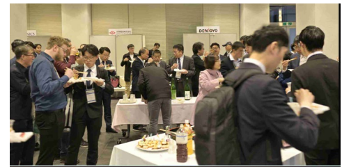
写真6 iWAT2024 レセプション様子

またiWAT2024にレセプションとバンケットに工夫し、参加者から大変好評をいただきました(写真6と7)。