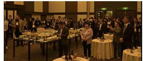
写真7 iWAT2024 バンケット様子

ベテランの皆さんに大変失礼いたしました。しかし、自分周りに分かっていない人が大勢にいることにショックを受けました。