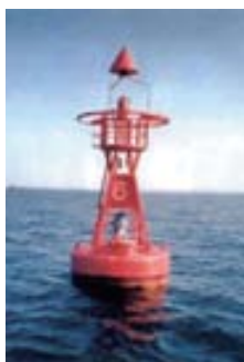
小形灯台では、既にLED化がかなり進展している