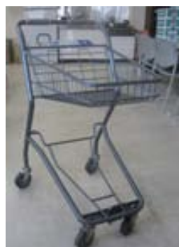
(b) カートに取り付けられた受信機