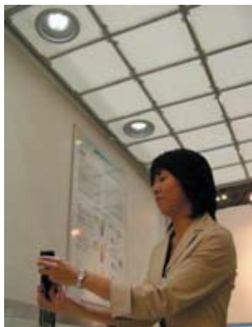
図1 可視光通信と携帯電話によるインターネットアクセスの組合せによる屋内位置検出 (NEC, 松下電工, 慶大の試作)

図1は、可視光通信と携帯電話によるインターネットアクセスの組合せによる屋内位置検出の例であるが、これはLED照明から送られた位置情報を基に、携帯電話でインターネット上のある場所サーバにアクセスして人