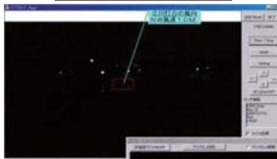
(2,780 f/s) / (1.3 kbit/s) 通信解像度: 0.016度/pix @ 10倍ズームレンズ = (1km先の30cm)