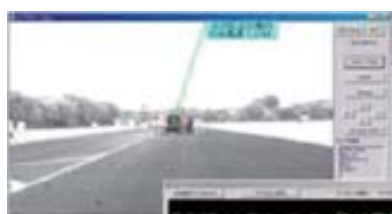
昼間 100m通信成功時画面