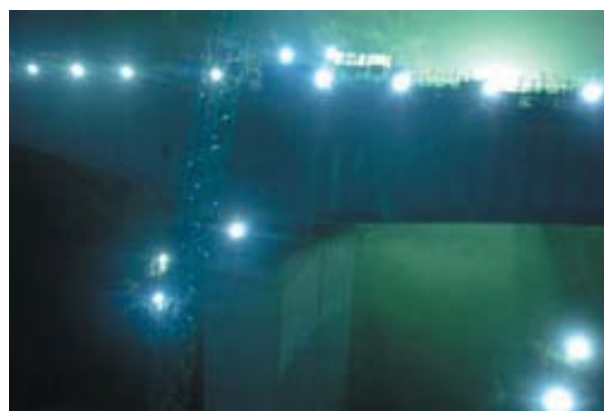
図6 可視光通信を用いた橋りょうの測量 (三井住友建設, 慶大, 中川研究所)

図7は、慶大とNECが行った可視光通信を用いたロボット制御の例である (12) 。可視光変調された複数のLED照明からの光を、2種類のイメージセンサで受ける。その1個は、光源の正確な方向を検出するための高解像度イメージセンサであり、もう1個は光源からの可