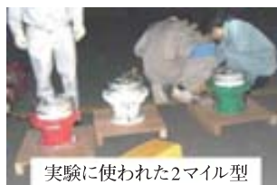
実験に使われた2マイル型LED灯台