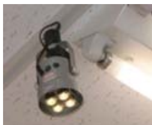
(a) 天井ランプ型ID送信機