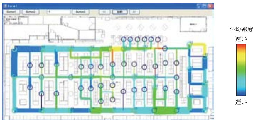
図3 スーパーマーケットでの動線解析システム (情報提供: 中川研究所)

図5には、灯台のLED光源を用いた可視光通信の実験風景が示されている。これは、2008年度から、海上保安庁海上保安試験研究センターから可視光通信コンソーシアム(VLCC)への研究依頼を受けてVLCCの会員企業(カシオ計算機, NEC, 東芝)が実験中のものであり、1km以上の長距離で灯台から船へのデータ通信をイメージセンサを利用して行おうというものである。なお、VLCCは、中川正雄慶大名誉教授が名誉会長、筆者が会長、坂村健東大教授と松本充司早大教授が副会長で、10数社のメンバー企業が活動が続いている